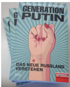
©2016 Deutsche Verlags-Anstalt

Wie tickt Russlands Jugend? Wie stellt sie sich dem politischen System und gesellschaftspolitischen Fragen? Und lässt sich dies überhaupt so pauschal beantworten? Benjamin Bidder zeigt eine Jugend zwischen dem Wunsch nach individueller Freiheit und systemkonformer Anpassung. Er dokumentiert dabei einerseits einen besorgniserregenden Rückbau demokratischer Rechte, liefert durch seine vorurteilsfreie Annäherung an Russlands junge Generation aber auch einen