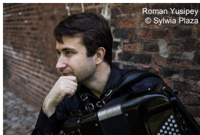
Roman Yusipej

Der ukrainische Bajanist Roman Yusipej zählt zu den renommiertesten Bajanisten Europas. Auf Grund seines virtuoseren Spiels und seiner ungewöhnlichen Vielfalt von Klangfarben und Emotionen war er schon mehrfach Inspirationsquelle für zeitgenössische Komponisten und begeistert das Publikum mit seinen Konzerten.